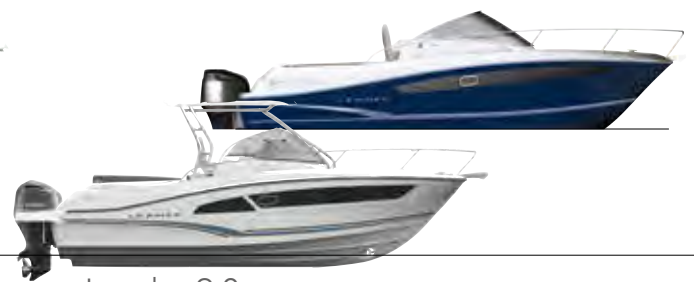
Leader 9.0 p. 34 – 37

EN Weekend cruising, water skiing, diving, fishing... In a Leader, with its stable, powerful hull, passenger safety is assured from tip to stern of the boat. The centerline cabin is designed for your comfort on those improvised weekend cruises.