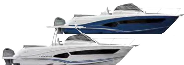
Leader 10.5 p. 30 – 33