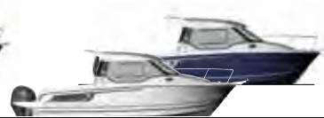
NC 795 & 795 Legend p. 16 - 19