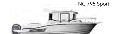
NC 795 Sport

ES Con su moderno diseño con fuerte personalidad, la NC 795 Sport ofrece una verdadera comodidad de navegación y de vida a bordo. Su probada carena, estable y rápida, aumenta su rendimiento. Con su estilo aventurero, esta «SUV de los mares» revela una gran amplitud de uso. Según su configuración (1-2-3 puertas), la NC 795 Sport favorece el programa de pesca o la excursión en familia. En modo «pesca», la gran bahía de popa con 3 paneles, las anchas puertas laterales, las cubiertas empotradas, aseguran y facilitan la circulación entre la cabina del piloto y la carlinga. El espacio ofrecido, máximo, puede recibir en función de las opciones elegidas todos los equipos dedicados a la pesca, así como a una cabina de pilotaje exterior (opcional). El 3º asiento de refuerzo (opcional) permite incluso pescas con amigos. En modo «excursión familiar», la NC 795 Sport asocia comodidad y espacios de convivencia con un banco adosado, detrás de la cabina de mando al abrigo del viento. Esto se encuentra frente a la cómoda carlinga cuadrada aún más grande, transformable en zona para tomar el sol.