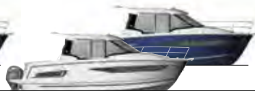
NC 895 & 895 Legend p. 12 - 15