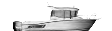
NC 695 Sport

ES A bordo del NC 695 Sport, volvemos a encontrar los ingredientes esenciales de la gama: un look aventurero, una puerta lateral que da acceso al pasillo lateral rebajado y una inmensa bañera de popa. ¡Tantos elementos que apreciarán los pescadores! La carena tradicional en V evolutiva, asociada a la motorización fueraborda, es rápida y estable a cualquier velocidad de marcha todo esto con la practicabilidad de motores fuera borda.