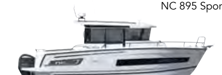
NC 895 Sport

ES Jeanneau prepara la nueva NC 895 Sport que se dará a conocer en primicia en el Salón Náutico de París (diciembre 2018). Dotada con el notable casco de la última NC 895, una cubierta súper tendencia y una cálida disposición interior, ¡este nuevo modelo promete un enfoque muy innovador de la famosa gama de la marca Jeanneau! ¡La NC 895 Sport será sobretodo una embarcación con una muy fuerte personalidad!