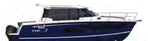
NC 1095 Legend

ES La nueva Merry Fisher 1095 es una weekender y una embarcación de crucero ideal para navegar en familia que disfruta de un volumen a bordo increíble! En el exterior, todo está pensado y dedicado a la seguridad, al confort y al relax. Dispone de una puerta lateral corredera, una pasarela empotrada y una puerta de corte que facilitan la circulación y el acceso a bordo. Apreciará su cabina modular, sus enormes plataformas de popa a un mismo nivel, una verdadera invitación para bañarse, y su muy cómoda zona para tomar el sol equipada con respaldos plegables. Según sean las salidas y el programa, el banco del copiloto se gira para crear un gran espacio de intercambio en el salón. De noche, ¡el banco también puede convertirse en litera!