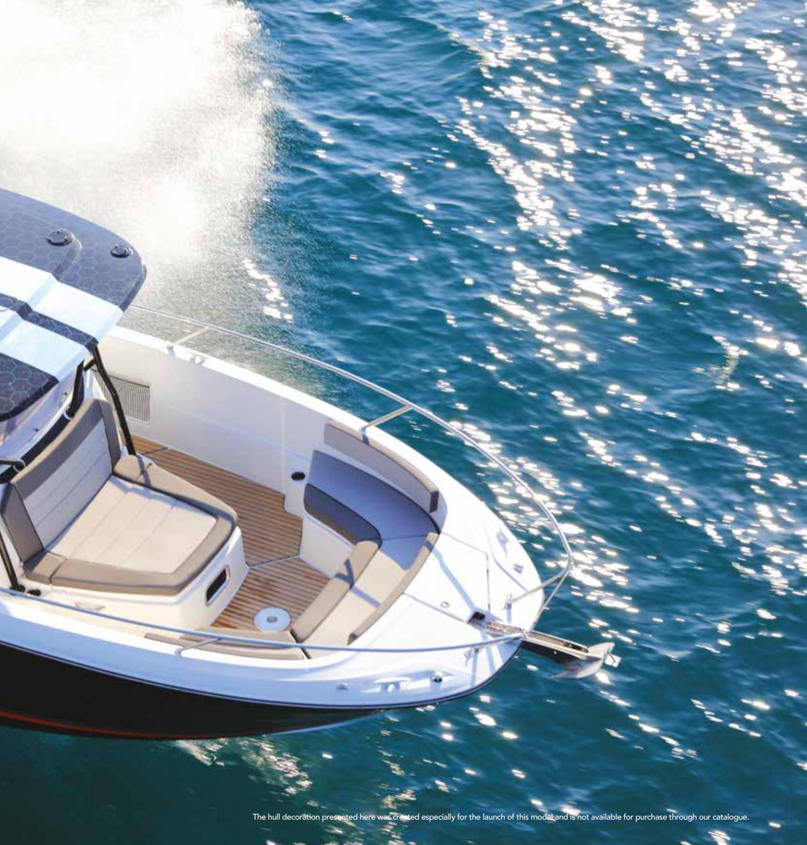
The hull decoration presented here was created especially for the launch of this model and is not available for purchase through our catalogue.

ES La Leader 9.0 Center Console ofrece un programa de navegación múltiple para emocionantes viajes al mar en familia o con amigos. ¡Esta nueva Center Console es perfecta para combinar pesca y momentos de convivencia! La consola central muy protectora, el tablero envolvente y las 3 plazas frente al mar garantizan una gran comodidad en la navegación. En popa, el banco central profundo, un auténtico sofá y los 2 asientos plegables completan la sensación de espacio y comodidad de la gran carlinga. Esta gran carlinga de popa puede acomodar una mesa para crear un espacio de zona de estar muy agradable, pero también puede convertirse en una gran zona de sol. Pensado para la relajación y el bienestar, este modelo tiene una magnífica cabina en la parte de proa que consiste en un verdadero meridiano y una zona de estar delantera, todo transformable en una gran zona de sol. Redes de almacenamiento, portacañas, peceras y diversos lugares de almacenamiento facilitan las actividades de pesca. Por primera vez en una Center Console de este tamaño, se dispone de cama doble central y de un compartimento independiente para baños / ducha.